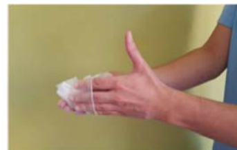
Retirar el guante sin tocar la parte externa del mismo