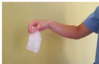
Retirar los dos guantes en el contenedor adecuado