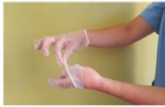
Retirar sin tocar la parte interior del guante