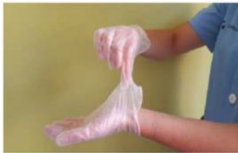
Pellizcar por el exterior del primer guante