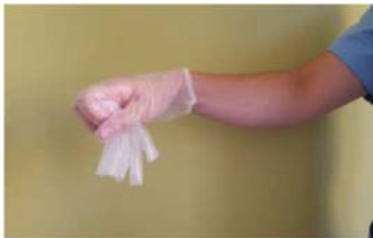
Recoger el primer guante con la otra mano