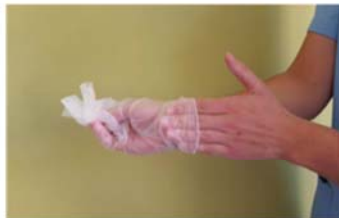
Retirar el segundo guante introduciendo los dedos por el interior