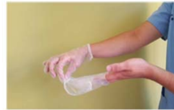
Retirar el guante en su totalidad